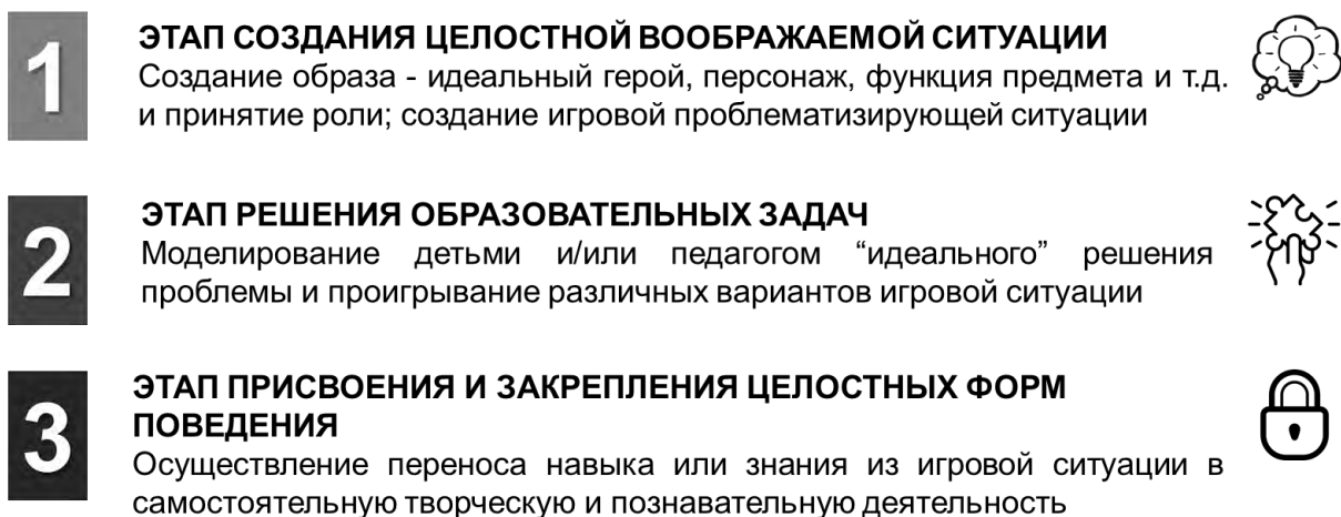
Рис. 1 Алгоритм разработки и совершенствования игровых технологий